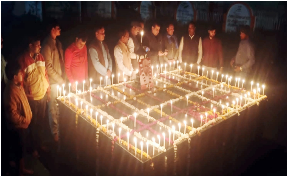
भाईजी की 96वीं जयंती की पूर्वसंध्या पर गाँधी आश्रम जौरा में भाईजी की समाधि पर दीपदान करते हुए जौरा विधायक।

देशभर में उत्सव और संकल्प : अहमदनगर, पुणे और भोपाल जैसे कई शहरों में भाई जी की जयंती पर शांति रैली, श्रमदान, और सामाजिक जागरूकता कार्यक्रम हुए। युवा कार्यकर्ताओं ने भाई जी की गांधीवादी विचारधारा को आगे बढ़ाने की शपथ ली।